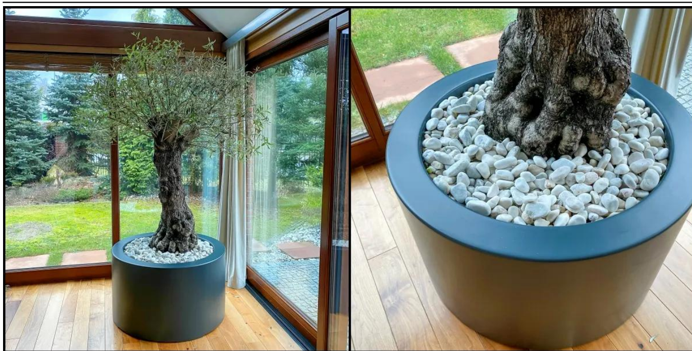
Drzewko oliwne w antracytowej donicy ZADORA Premium D901ED

BARTPOL Sp. z o.o. ul. Głogowska 218 60-104 Poznań NIP: 6932050703 t. 61 661 61 78 t. 607 531 181