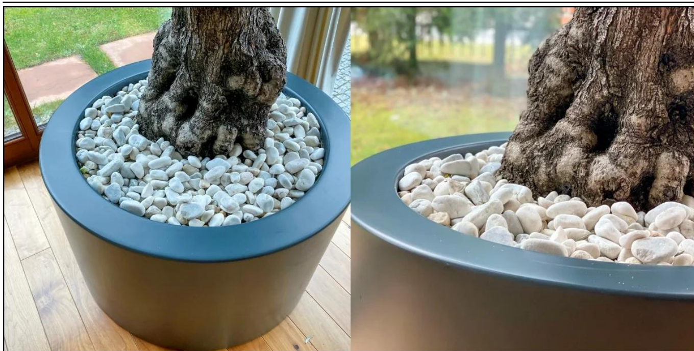
Drzewko oliwne w antracytowej donicy ZADORA Premium D901ED Ø80x60 cm

BARTPOL Sp. z o.o. ul. Głogowska 218 60-104 Poznań NIP: 6932050703 t. 61 661 61 78 t. 607 531 181