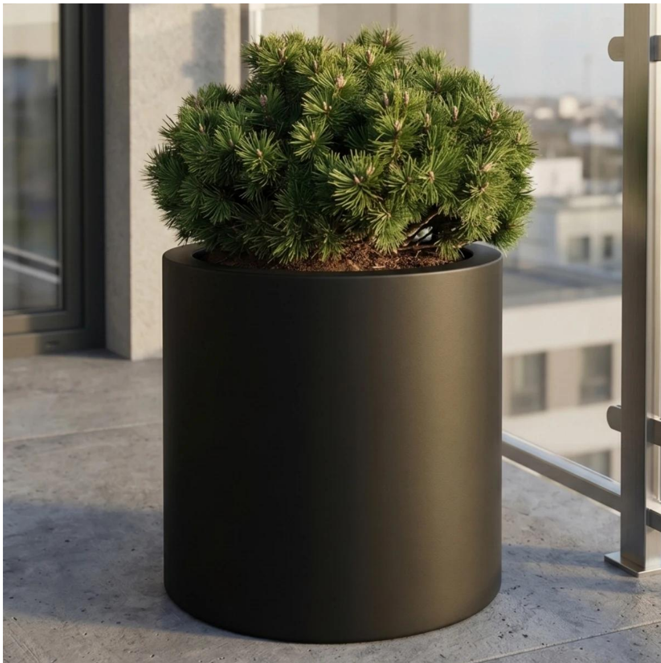
Donica ZADORA Premium D901D czarny mat na balkonie