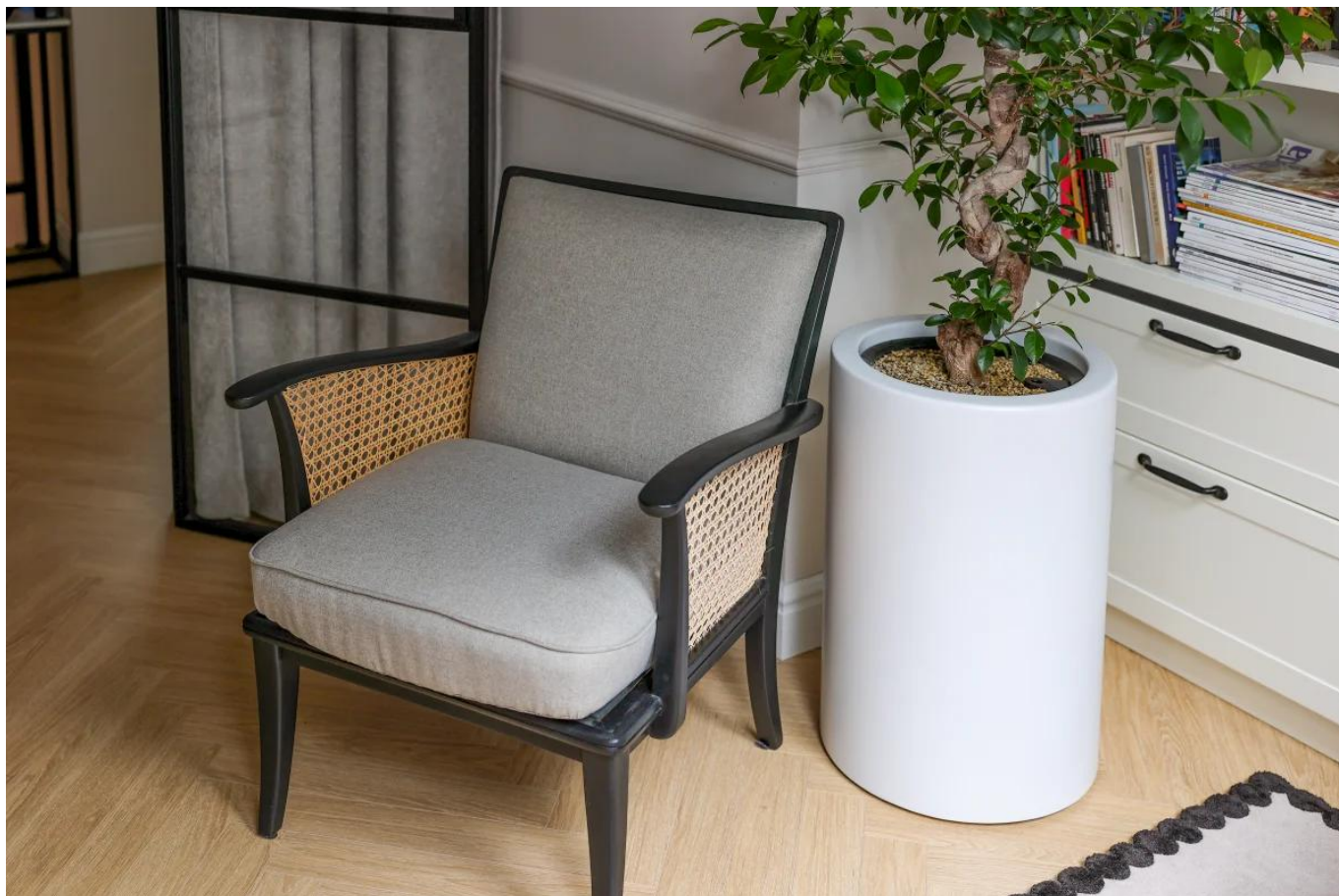
Donica ZADORA Premium D901BA Ø40x60 cm biały mat

Na zdjęciu widzimy donicę ZADORA D901BA w kolorze biały mat, która doskonale komponuje się z naturalnymi akcentami wystroju – plecionym fotelem, drewnianą podłogą i zielenią bonsai. Jej subtelna forma i gładka, matowa powierzchnia wprowadzają do wnętrza spokój i elegancję, podkreślając nowoczesny, ale przytulny charakter przestrzeni. To idealny przykład, jak prostota i jakość wykonania mogą tworzyć stylową całość w każdym domu.