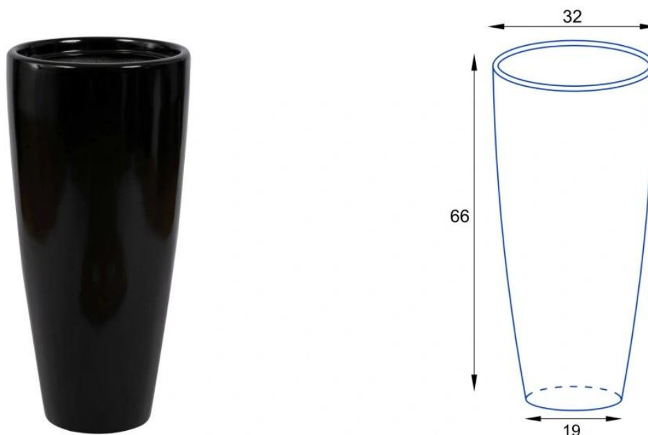
Donica D282C/BPD - wymiary wersji bez wkładu

Model D282C/BPD, pozbawiony jest wewnętrznej półki i oferuje aż 45 litrów pojemności, co czyni go idealnym do uprawy palm i innych roślin zewnętrznych. Przy użytkowaniu na zewnątrz zaleca się wykonanie otworów odpływowych w dnie donicy.