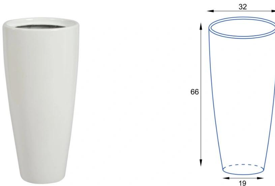
Donica D282C/BPD - wymiary wersji bez wkładu

Model D282C/BPD nie posiada wewnętrznej półki, co przekłada się na dość dużą objętość donicy wynoszącą około 45 litrów. W tej wersji donica będzie odpowiednia dla palm oraz do użytkowania na zewnątrz. Wypełniona w całości ziemią zachowa stabilność i będzie idealną donicą na balkon lub taras. Pamiętaj, że w przypadku użytkowania na zewnątrz konieczne jest wykonanie w jej dnie otworów odpływowych.