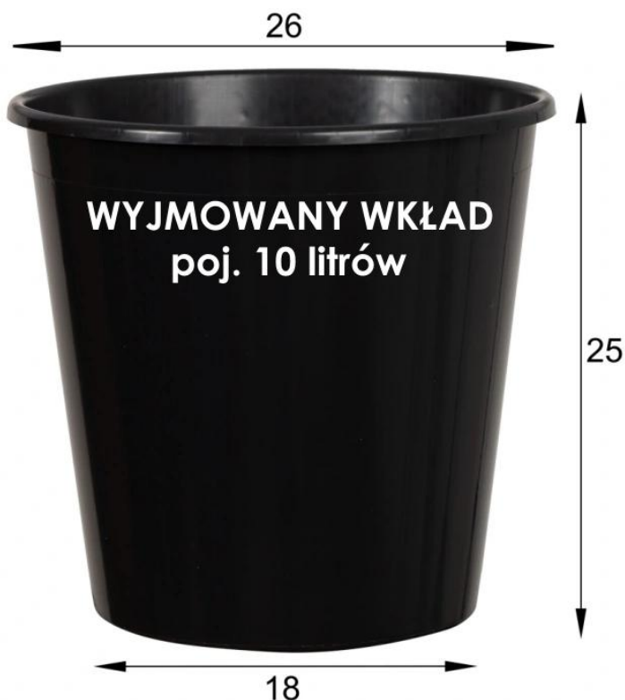
Donica ZADORA Classic D282C/BPD bez wkładu i z wewnętrznym wkładem

Biała donica D282C/BPD jest bardzo uniwersalna. W wersji bez wkładu wykorzystasz ją dla dużych roślin domowych, takich jak okazałe palmy lub na zewnątrz dla roślin wieloletnich. W opcji z wewnętrznym wkładem będzie natomiast idealna dla większości roślin ozdobnych wykorzystywanych do dekoracji wnętrz domowych i biurowych.