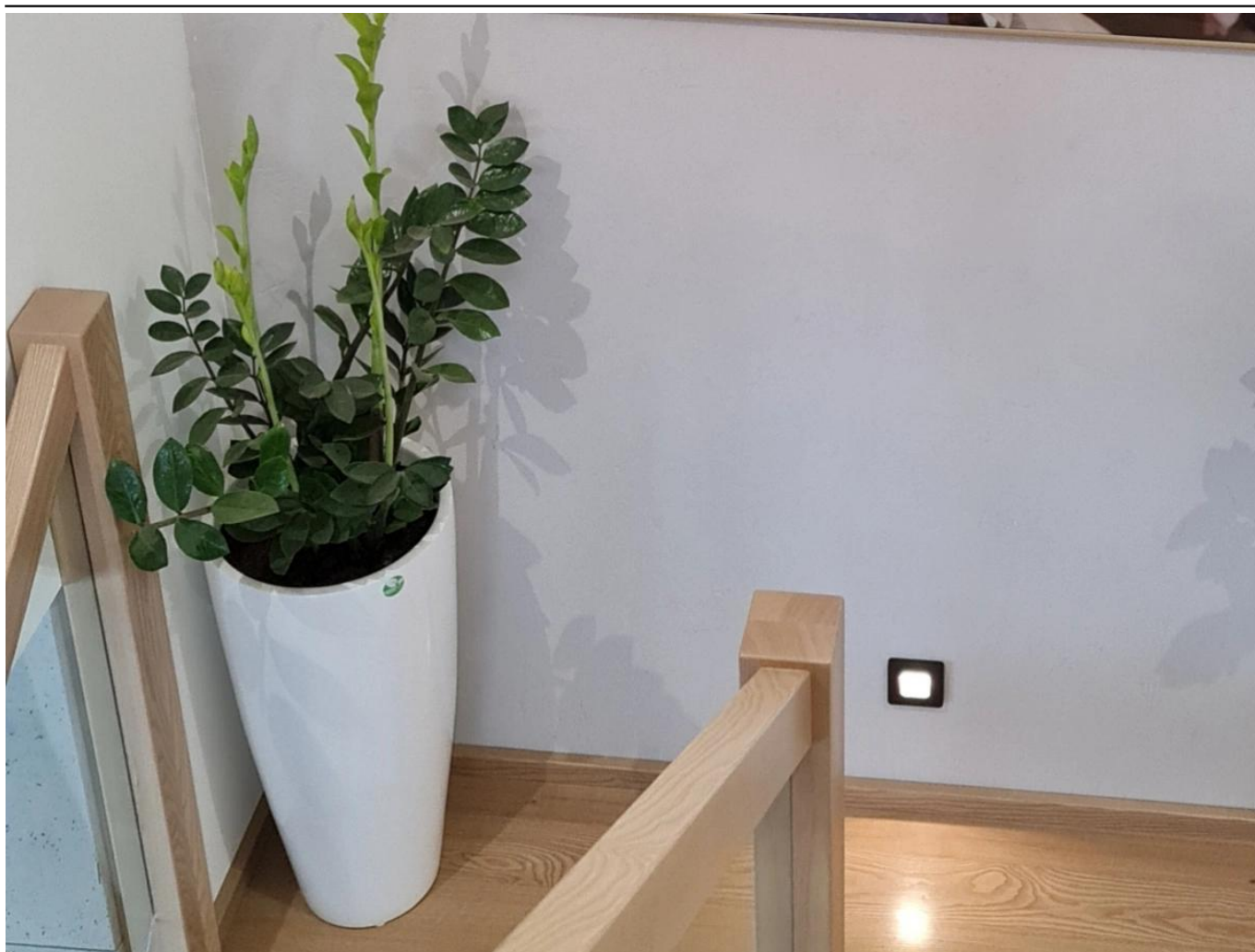
Zamiokulkas zamiolistny w białej donicy Zadora Classic D282C

BARTPOL Sp. z o.o. ul. Głogowska 218 60-104 Poznań NIP: 6932050703 t. 61 661 61 78 t. 607 531 181