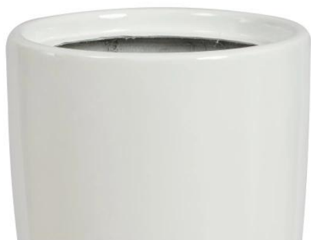
donica D282C z wkładem