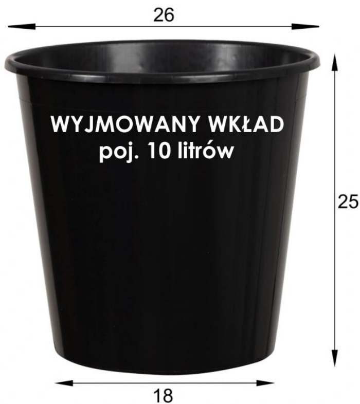
Donica ZADORA Classic D282C/BPD bez wkładu i z wewnętrznym wkładem

Antracytowa, matowa donica D282C/BPD cechuje się dużą wszechstronnością. W wersji bez wkładu świetnie sprawdzi się przy uprawie większych roślin domowych, takich jak imponujące palmy, lub roślin wieloletnich na zewnątrz. Z kolei z wewnętrznym wkładem będzie doskonałym wyborem dla większości roślin ozdobnych, które nadają się do dekoracji wnętrz domowych i biurowych.