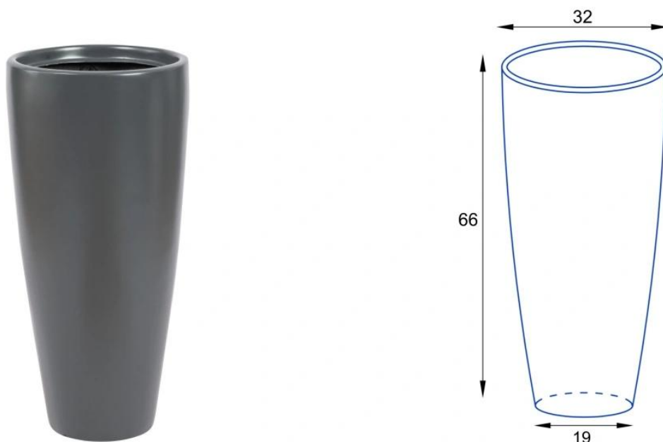
Donica D282C/BPD - wymiary wersji bez wkładu

Model D282C/BPD nie posiada wewnętrznej półki, co sprawia, że jej objętość wynosi około 45 litrów. W tej wersji donica doskonale nadaje się do sadzenia palm oraz do użytku na zewnątrz. Wypełniona ziemią, pozostaje stabilna i stanowi idealny wybór na balkon lub taras. Pamiętaj, że przy użytkowaniu na zewnątrz należy wykonać w dnie otwory odpływowe.