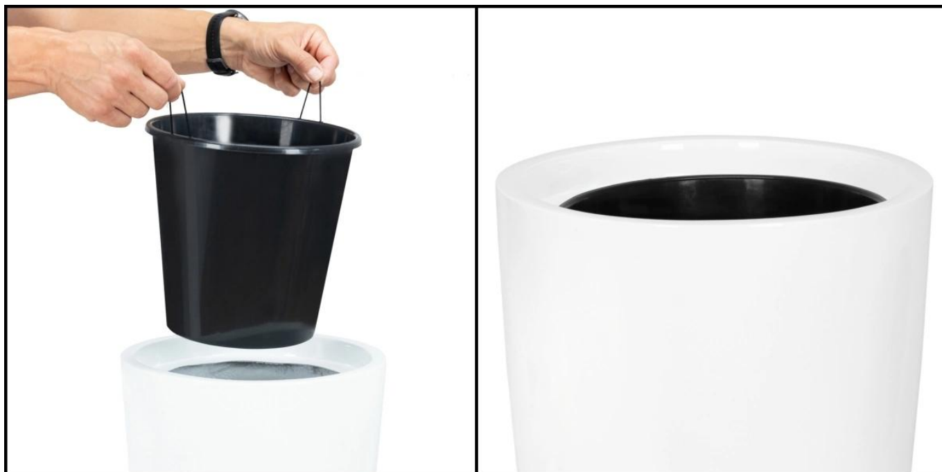
Wymowany wewnętrzny wkład idealnie pasuje do donicy

Donica D208C/BPD została zaprojektowana z myślą o zawieszeniu wymowanego wkładu na wewnętrznej ramce. To eleganckie rozwiązanie gwarantuje stabilne umiejscowienie wkładu i eliminuje potrzebę używania dodatkowych wypełniaczy w donicy.