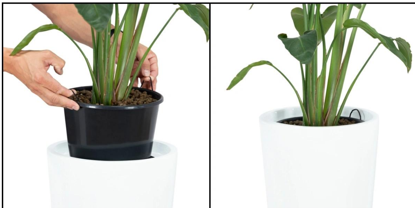
Stosowanie wyjmowanego wkładu zalecane jest do mniejszych roślin ozdobnych

W przypadku wyboru wkładu warto wywiercić kilka otworów w jego dnie, aby umożliwić odpływ nadmiaru wody. Korzystanie z tego rozwiązania zapewnia dużą wygodę i ułatwia pielęgnację roślin. Donica D208C/BPD z wyjmowanym wkładem to praktyczne i funkcjonalne rozwiązanie zarówno do domu, jak i biura, oferujące łatwość przenoszenia i wymiany roślin, co otwiera nowe możliwości aranżacyjne.