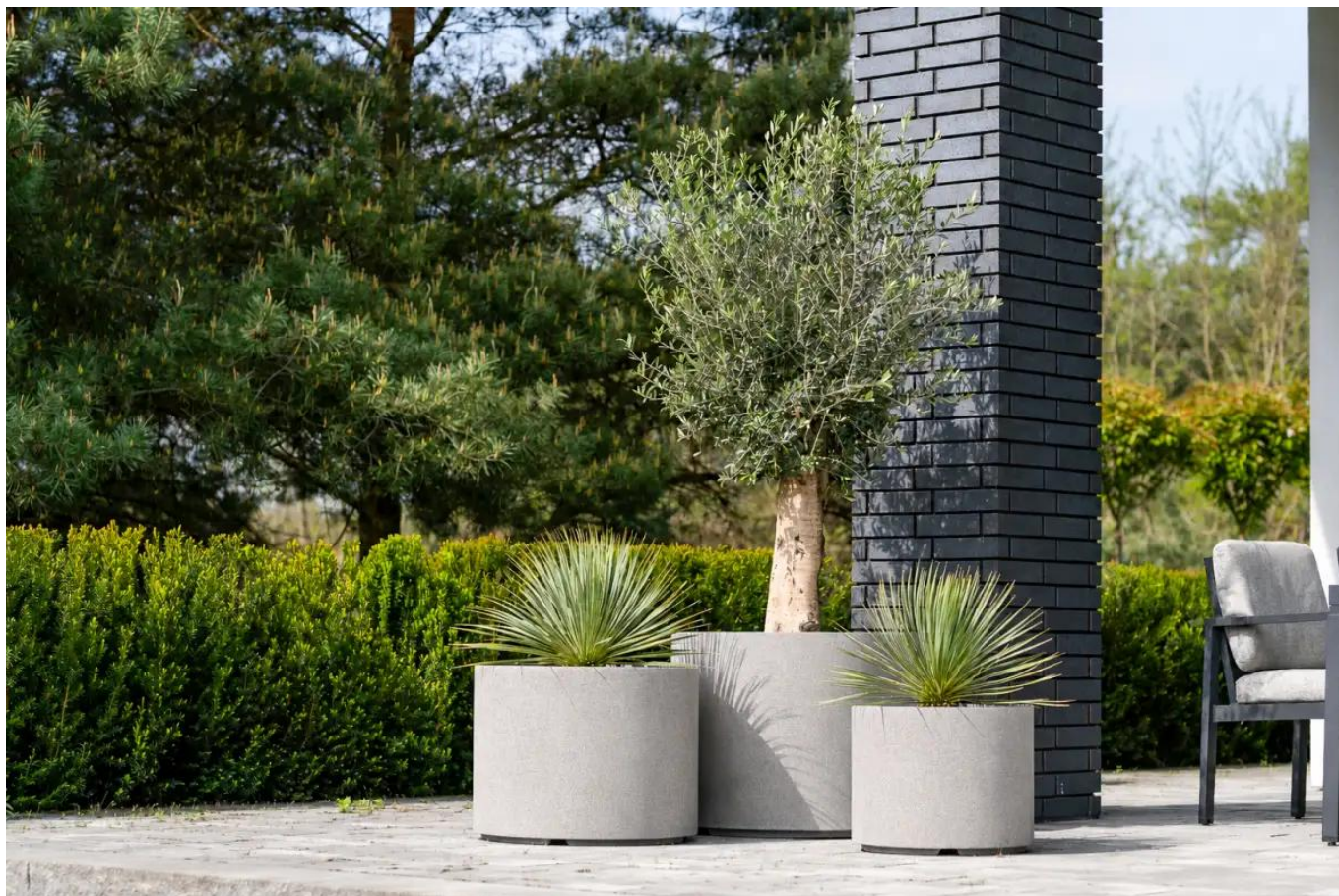
Donice D101CA, D101CD i D101ED w kolorze szary piaskowiec