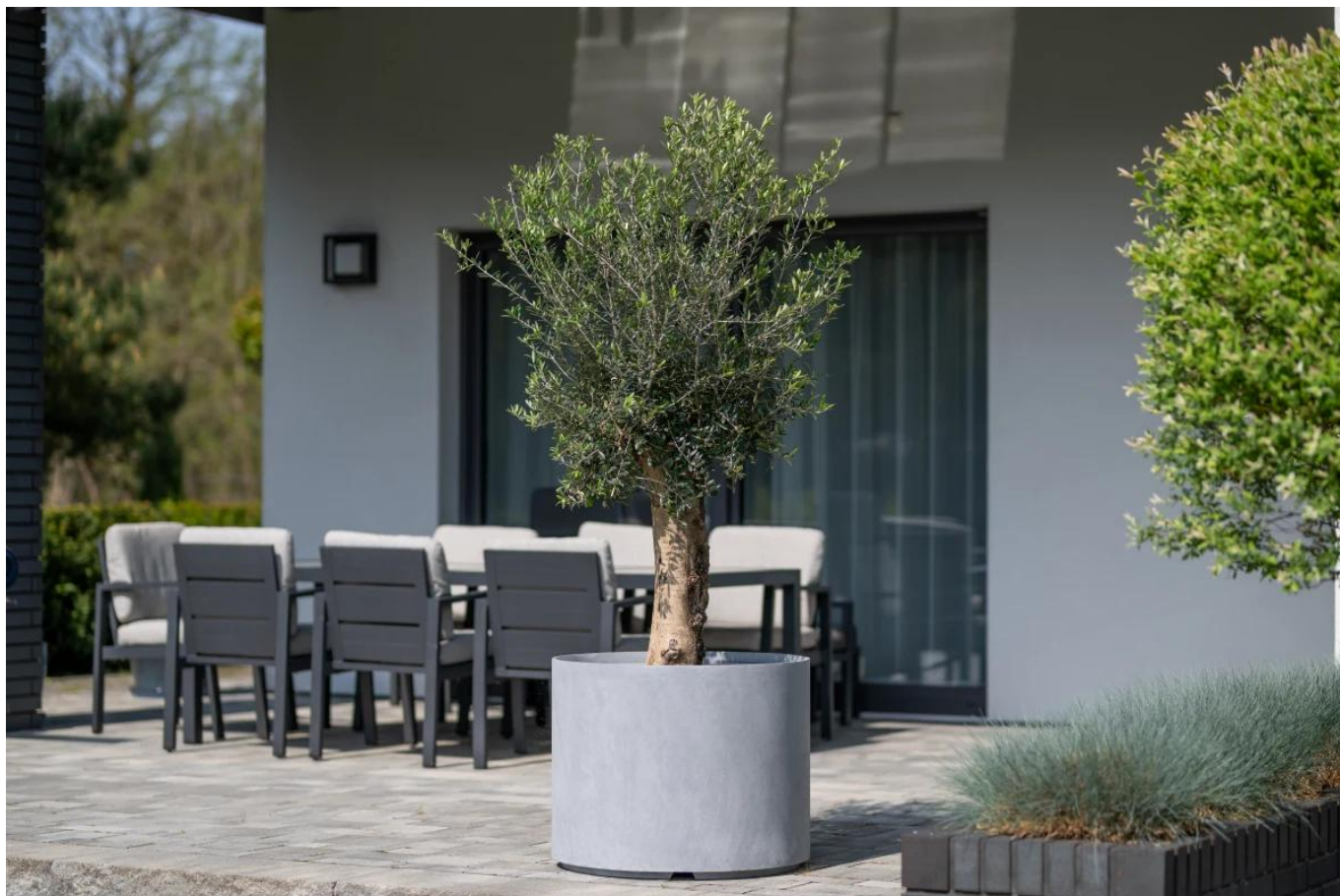
Oliwka europejska w donicy D101ED szary beton na tarasie