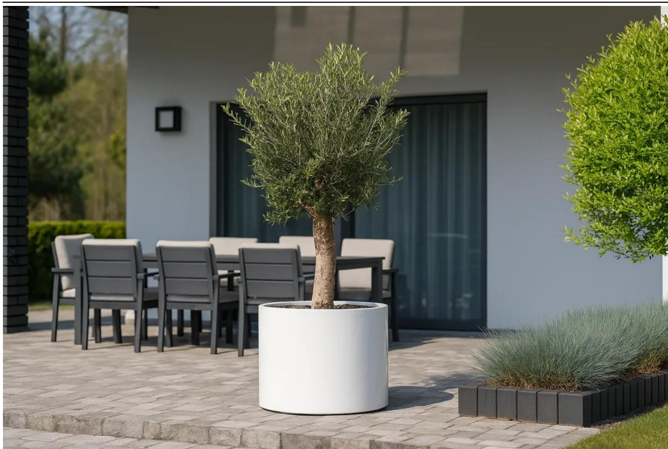
Oliwka europejska w donicy D101ED biały połysk na tarasie

BARTPOL Sp. z o.o. ul. Strzeszyńska 33 60-479 Poznań NIP: 6932050703 t. 61 661 61 78 t. 607 531 181