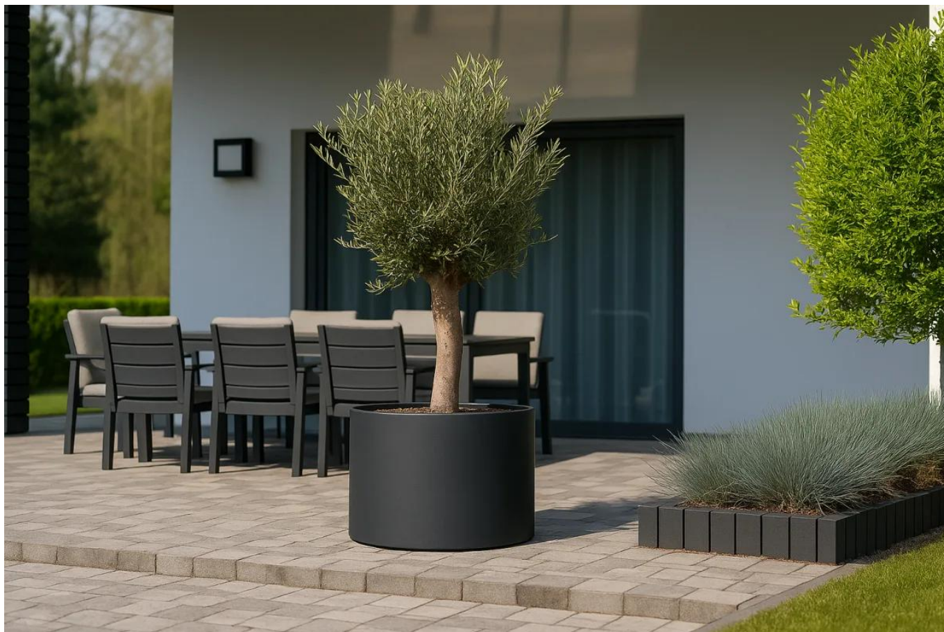
Oliwka europejska w donicy D101ED antracyt mat na tarasie

Objętość donicy wynosząca aż 265 litrów to idealna przestrzeń do uprawy dużych roślin.