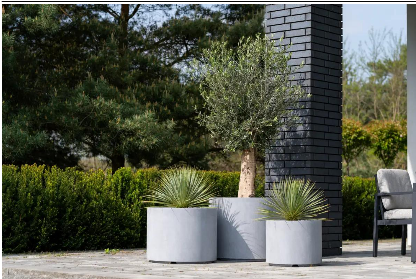
Donice D101CA, D101CD i D101ED w kolorze szary beton

BARTPOL Sp. z o.o. ul. Strzeszyńska 33 60-479 Poznań NIP: 6932050703 t. 61 661 61 78 t. 607 531 181