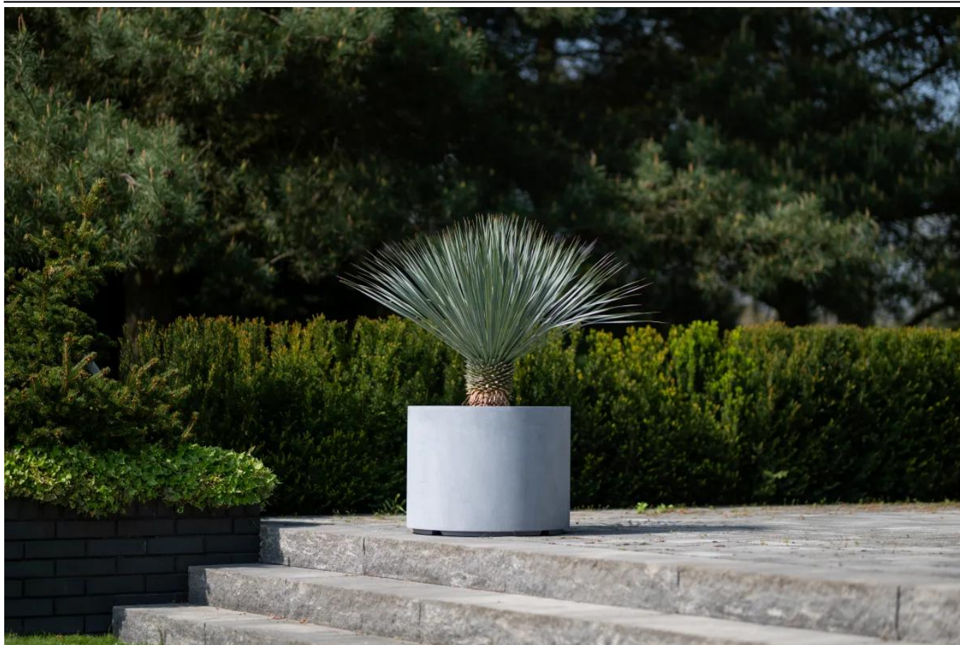
Juka rostrata w donicy D101DC szary beton na tarasie

BARTPOL Sp. z o.o. ul. Strzeszyńska 33 60-479 Poznań NIP: 6932050703 t. 61 661 61 78 t. 607 531 181