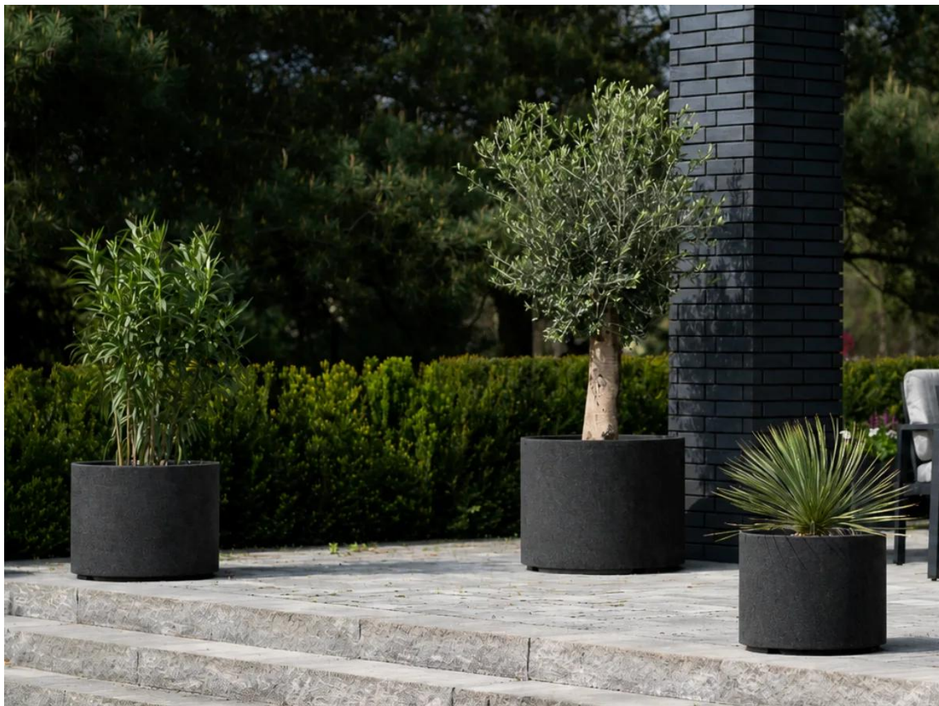
Donice tarasowe ZADORA Sand D101CA, D101DC i D101ED w kolorze czarny piaskowiec