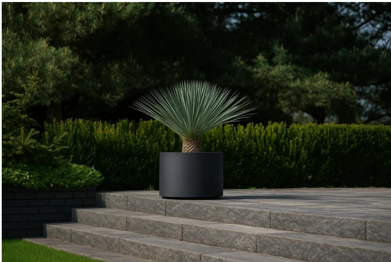
Juka rostrata w donicy D101DC czarny piaskowiec na tarasie