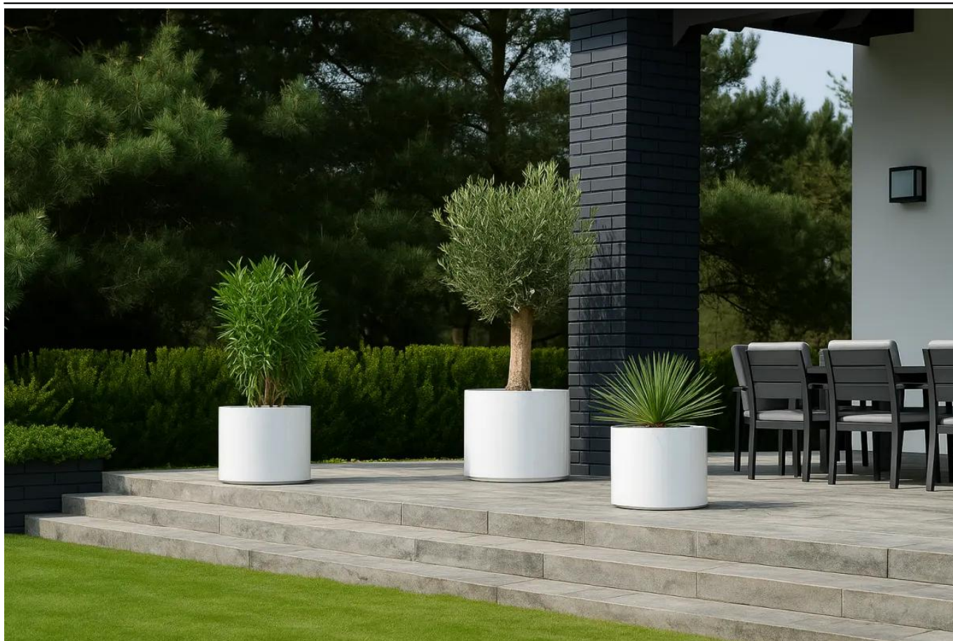
Donice D101CA, D101CD i D101ED w kolorze biały połysk

BARTPOL Sp. z o.o. ul. Strzeszyńska 33 60-479 Poznań NIP: 6932050703 t. 61 661 61 78 t. 607 531 181