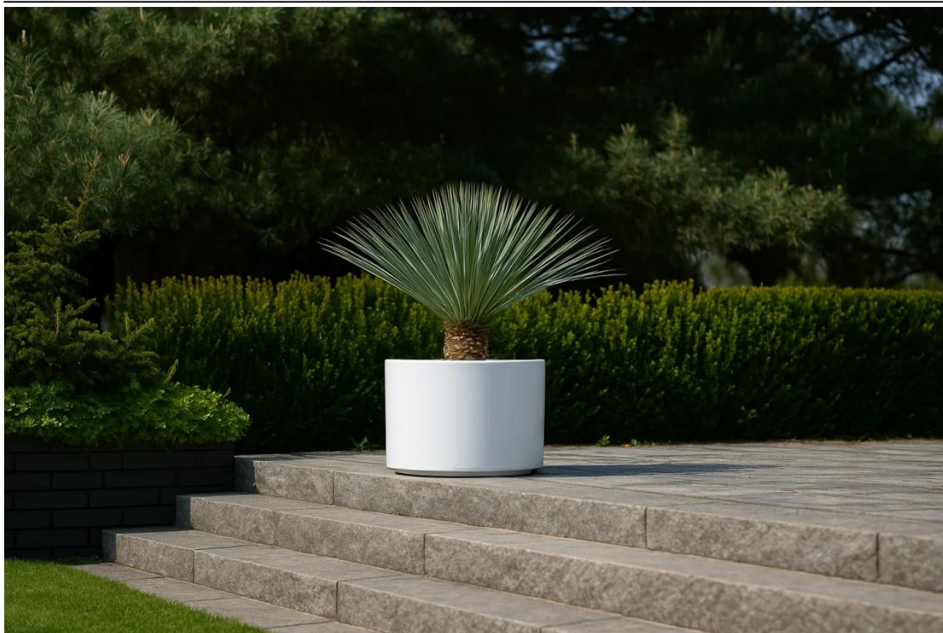
Juka rostrata w donicy D101DC biały połysk na tarasie

BARTPOL Sp. z o.o. ul. Strzeszyńska 33 60-479 Poznań NIP: 6932050703 t. 61 661 61 78 t. 607 531 181