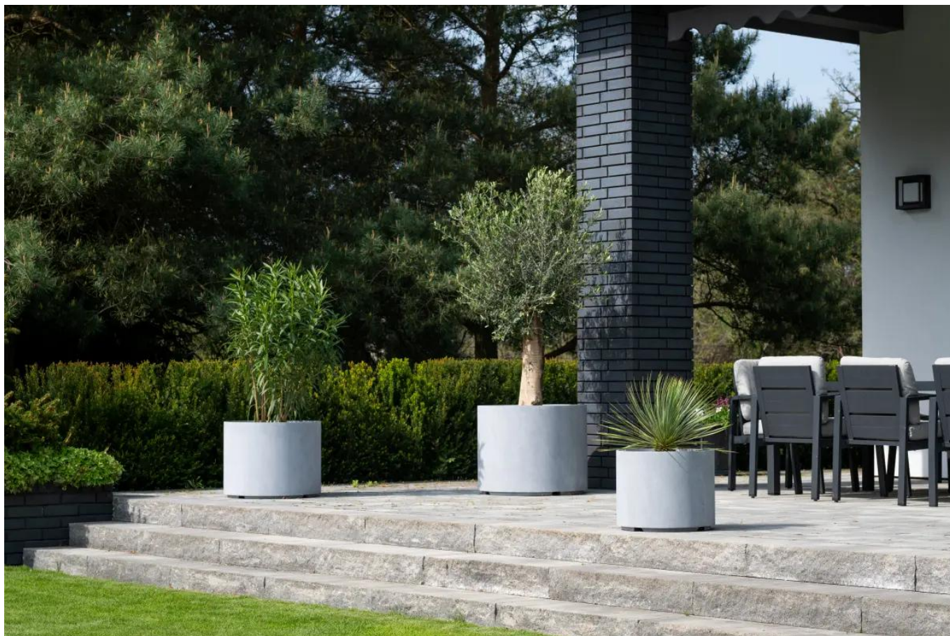
Donice D101CA, D101CD i D101ED w kolorze szary beton