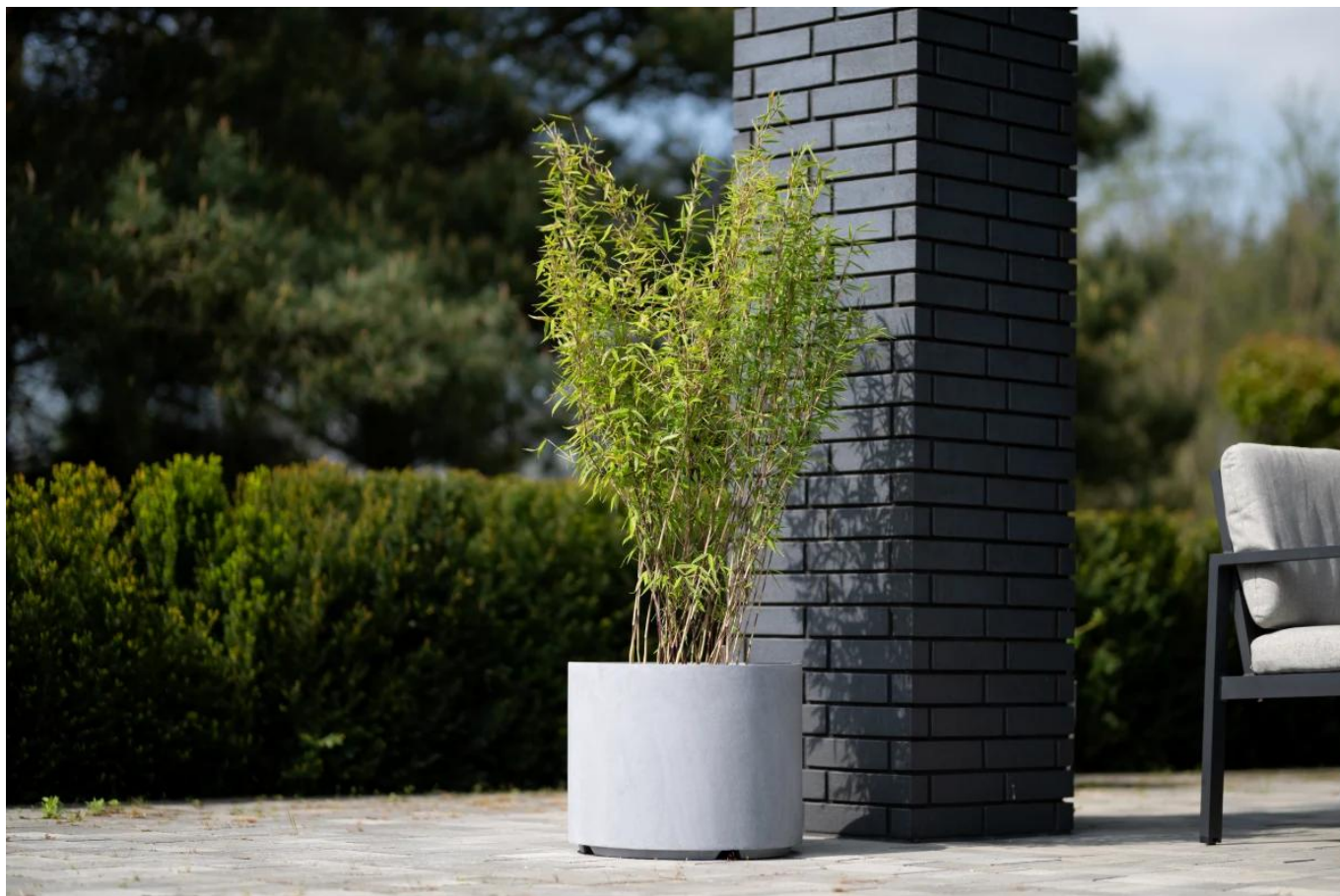
Bambus Nitida fargesia volcano w donicy D101CA szary beton na tarasie