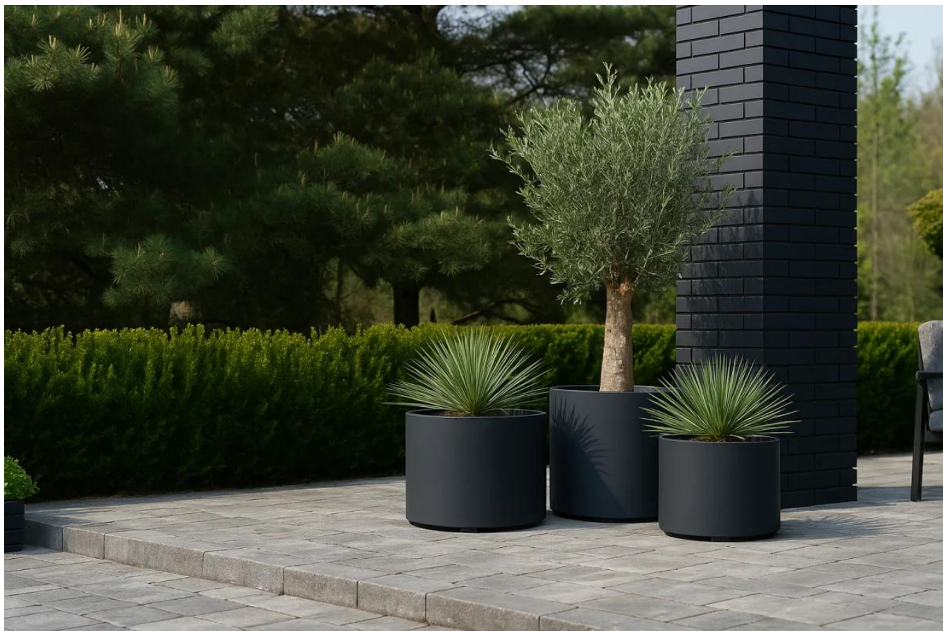
Donice D101CA, D101CD i D101ED w kolorze czarny piaskowiec