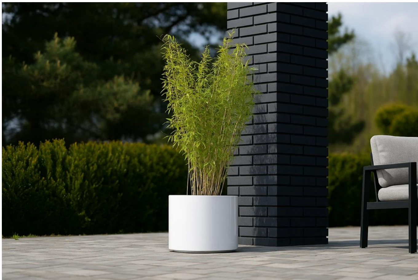
Bambus Nitida fargesia volcano w donicy D101CA biały połysk na tarasie