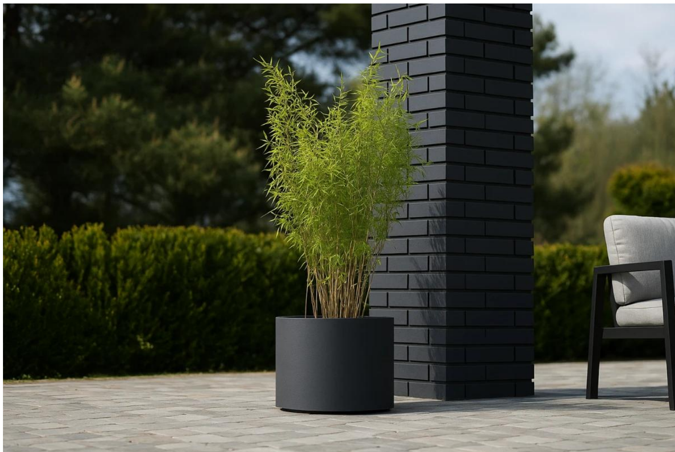
Bambus Nitida fargesia volcano w donicy D101CA antracyt mat na tarasie