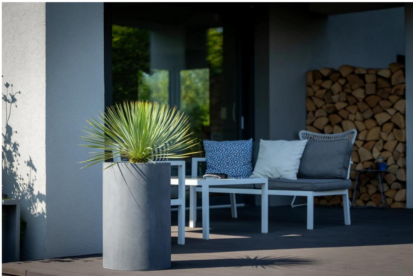
Donica tarasowa D101C Ø40x60 cm grafitowy beton