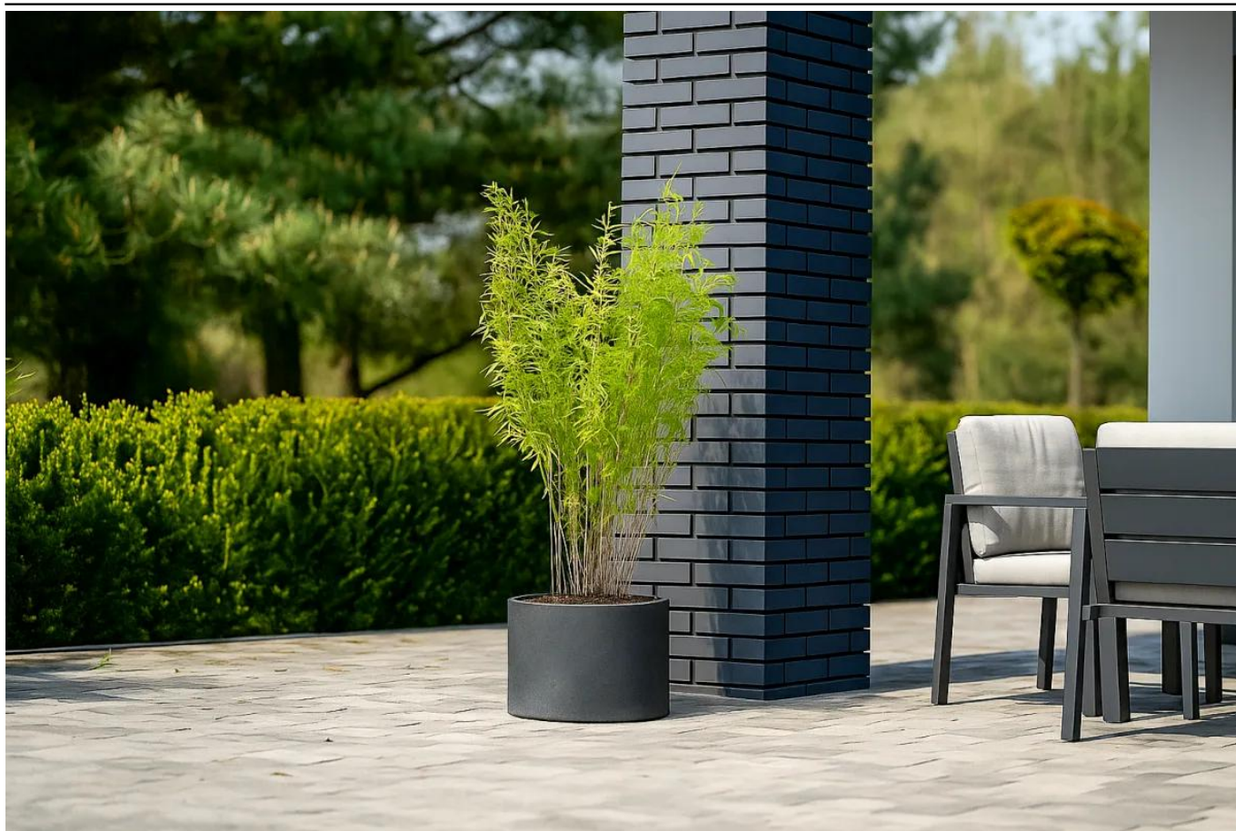
Donica D101A grafitowy beton z bambusem na nowoczesnym tarasie

BARTPOL Sp. z o.o. ul. Strzeszyńska 33 60-479 Poznań NIP: 6932050703 t. 61 661 61 78 t. 607 531 181