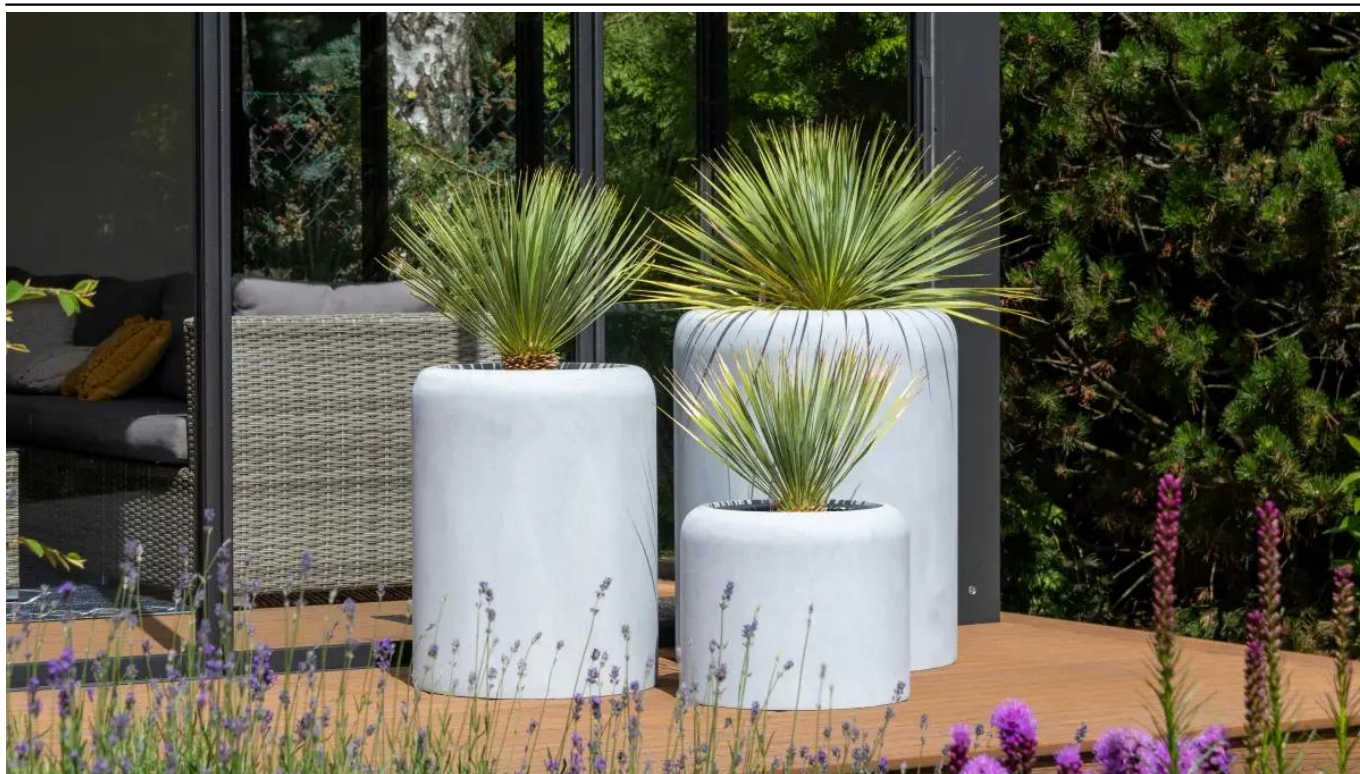
Donice AMBIENTE 35, 60 i 70 w kolorze szary beton

BARTPOL Sp. z o.o. ul. Głogowska 218 60-104 Poznań NIP: 6932050703 t. 61 661 61 78 t. 607 531 181