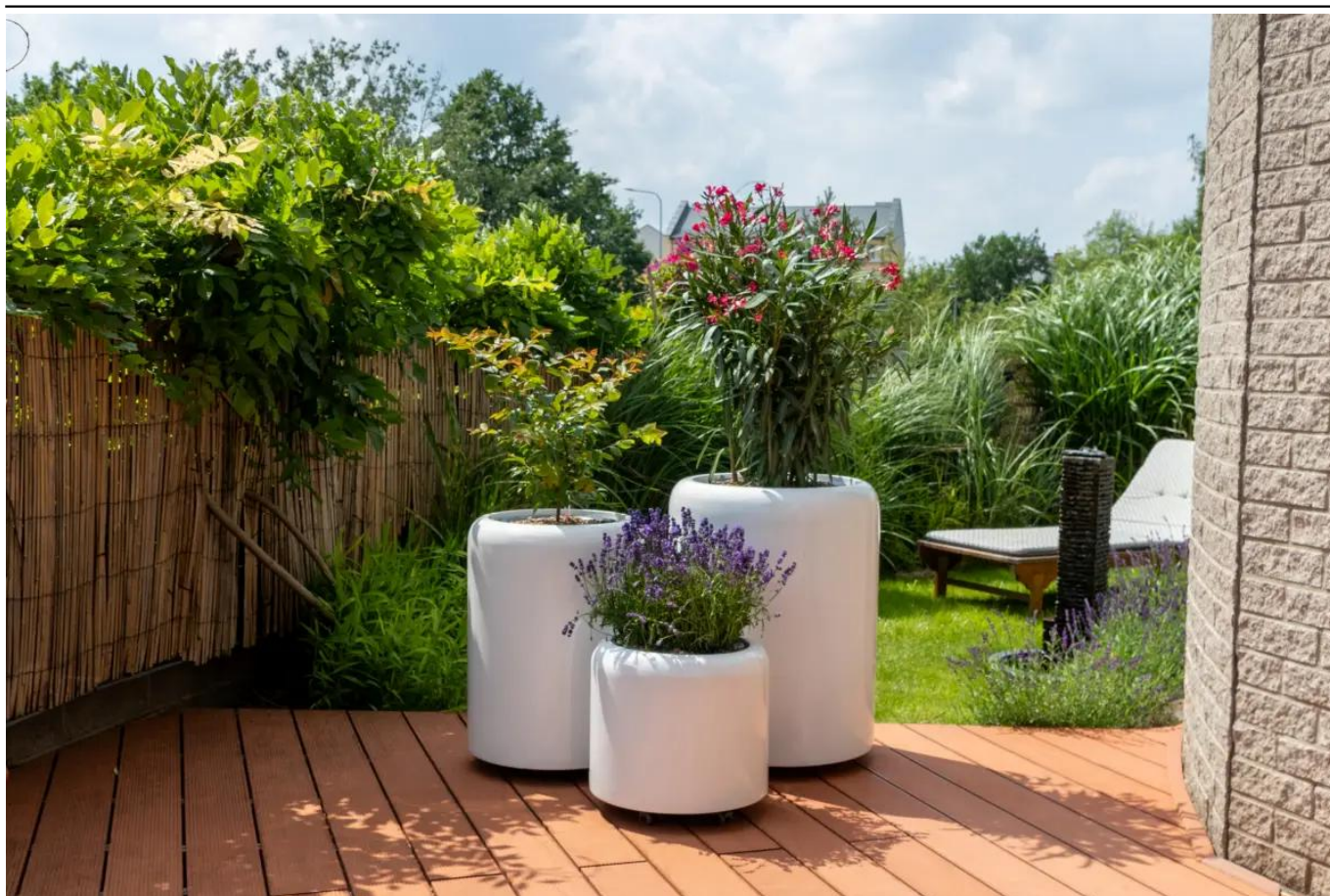
Podstawa z kólkami - opcja dodatkowa

BARTPOL Sp. z o.o. ul. Głogowska 218 60-104 Poznań NIP: 6932050703 t. 61 661 61 78 t. 607 531 181