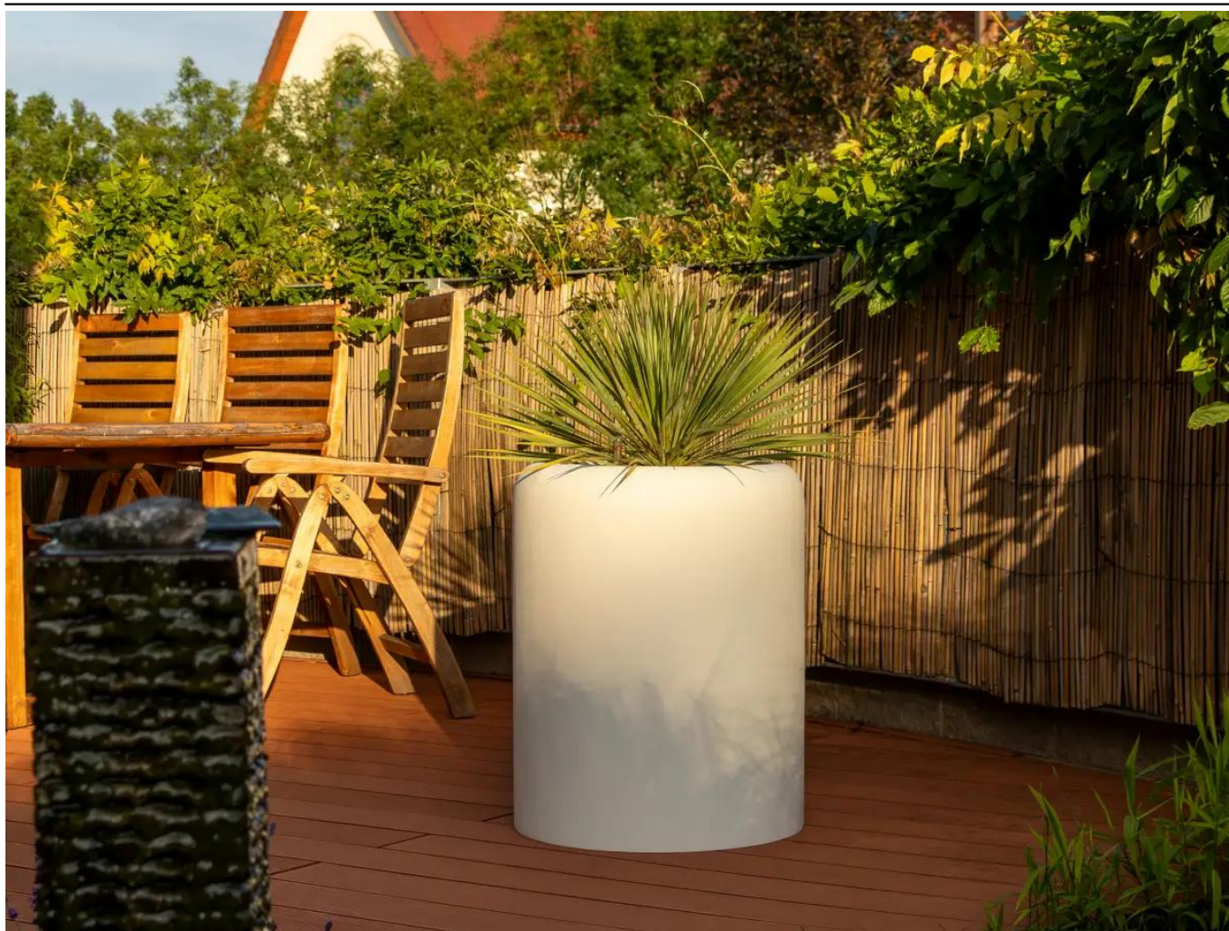
Donica AMBIENTE 70 biały beton na taras

BARTPOL Sp. z o.o. ul. Głogowska 218 60-104 Poznań NIP: 6932050703 t. 61 661 61 78 t. 607 531 181