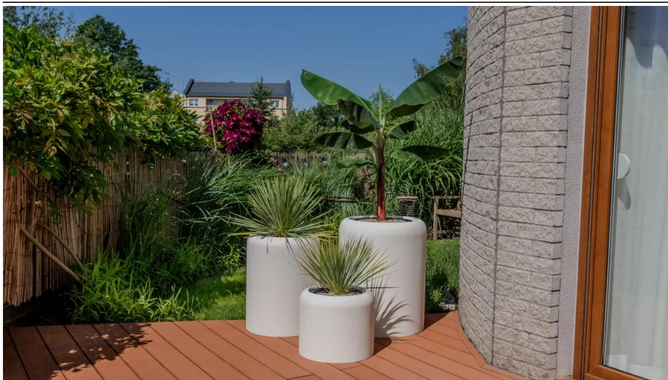
Donice AMBIENTE 35, 60 i 70 w kolorze biały beton

BARTPOL Sp. z o.o. ul. Głogowska 218 60-104 Poznań NIP: 6932050703 t. 61 661 61 78 t. 607 531 181