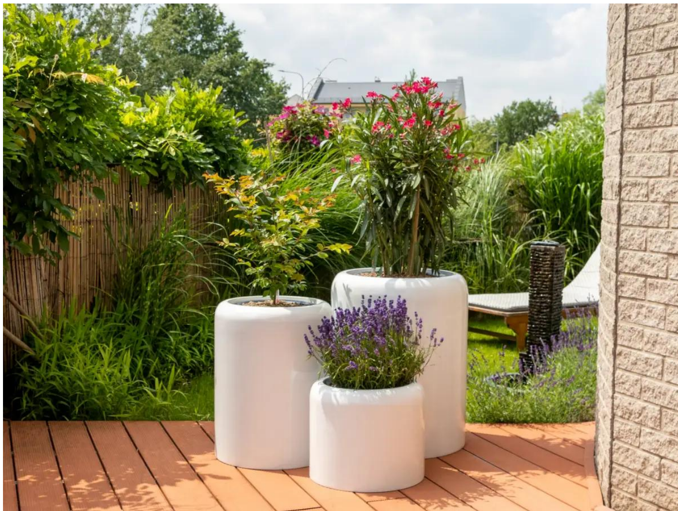
Donice AMBIENTE 35, 60 i 70 w kolorze biały połysk

Donice AMBIENTE otwierają drzwi do nowych możliwości - wprowadzenia wyjątkowych roślin do naszego codziennego otoczenia, tworząc harmonijne oazy zarówno w domach, jak i biurach. Ich wszechstronność pozwala na tworzenie efektownych aranżacji roślin zarówno wewnątrz, jak i na zewnątrz, dostosowanych do różnorodnych potrzeb i stylów. Dzięki różnym rozmiarom i kolorom, donice AMBIENTE umożliwiają kreatywne kompozycje roślinne, które dodają uroku tarasom, mieszkaniom oraz przestrzeniom biurowym.