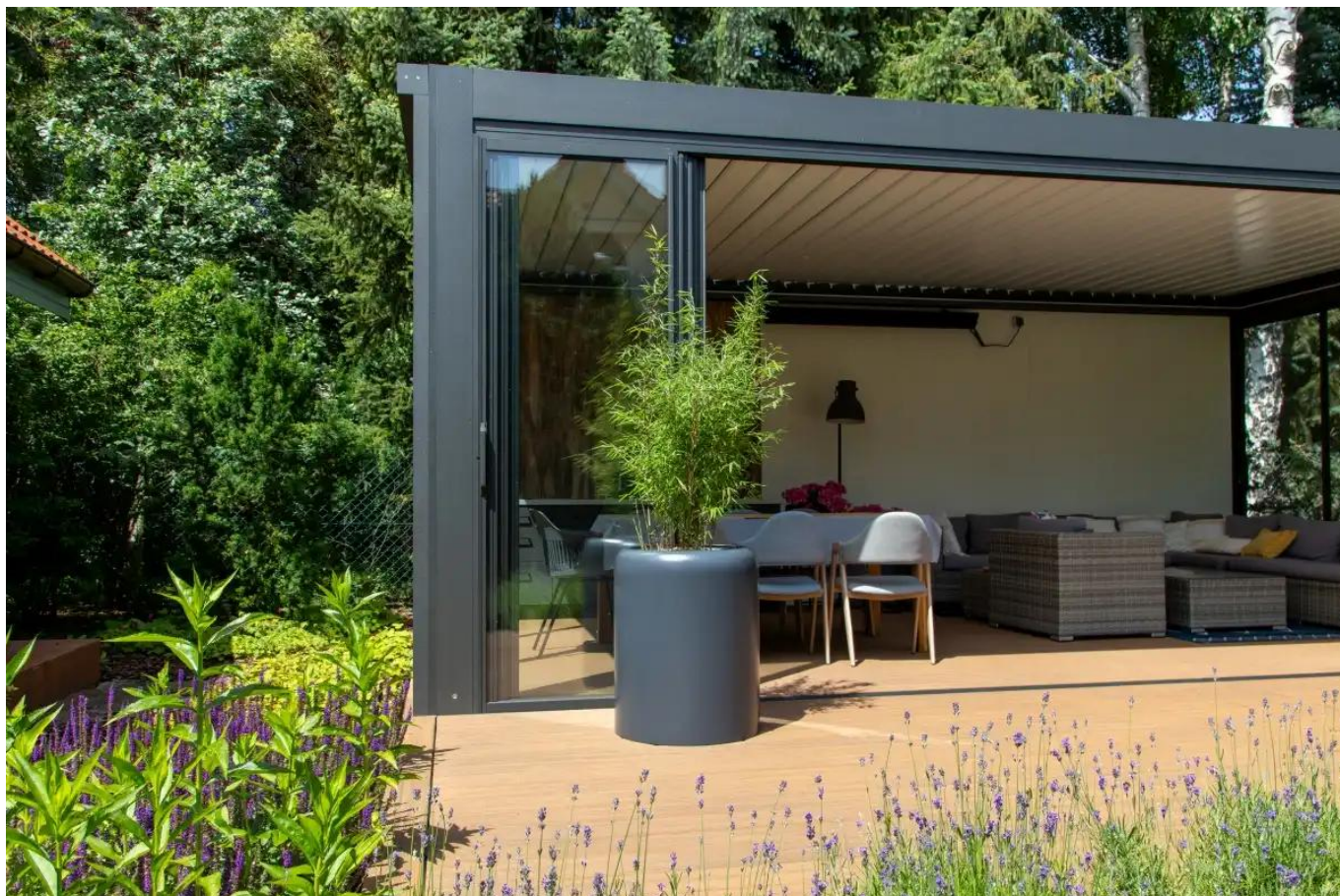
Bambus w donicy tarasowej AMBIENTE 70 antracyt mat

Donica AMBIENTE 70 antracyt mat z wyjmowanym wkładem i systemem nawadniania.