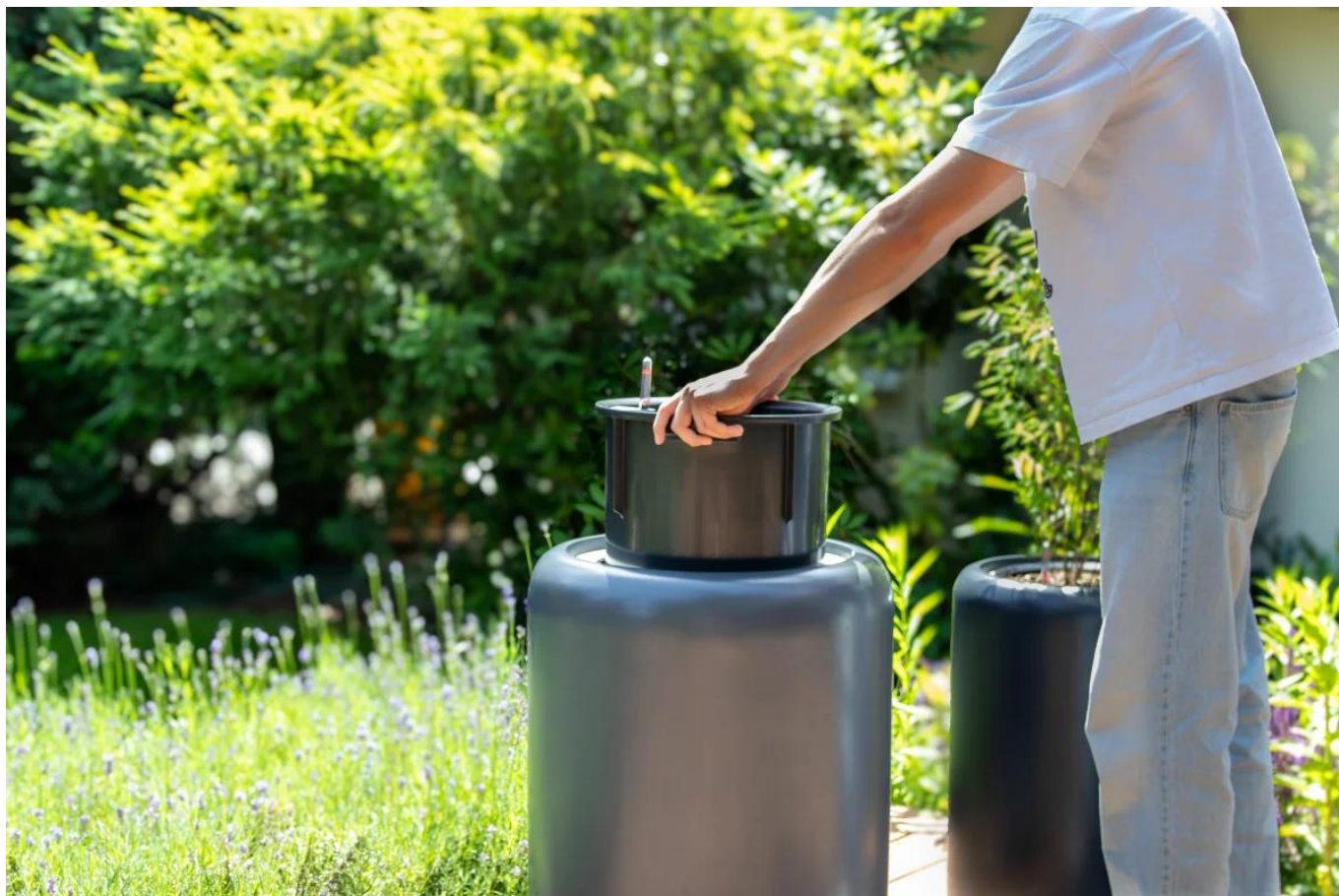
Wymowany wkład SWIP 38x38 cm z systemem nawadniania

Donica tarasowa AMBIENTE 70 antracyt mat o średnicy 56 cm i wysokości 70 cm.