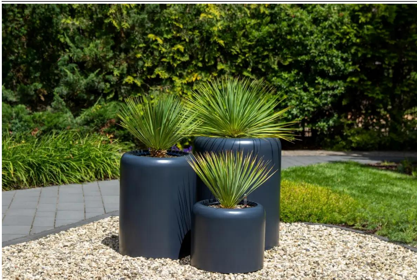
Zestaw donic tarasowych AMBIENETE 35, 60 i 70 cm antracyt mat

BARTPOL Sp. z o.o. ul. Głogowska 218 60-104 Poznań NIP: 6932050703 t. 61 661 61 78 t. 607 531 181