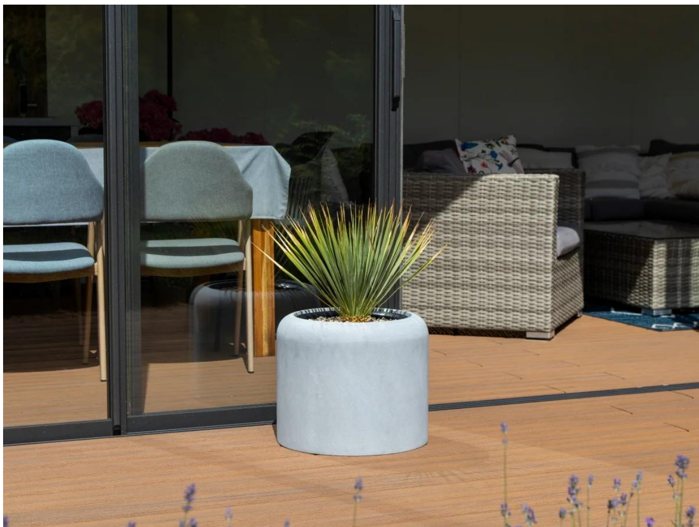
Juka rostrata na tarasie w donicy ZADORA Classic AMBIENTE 35 biały beton

tworzyć wyjątkową atmosferę pełną roślinnego uroku.