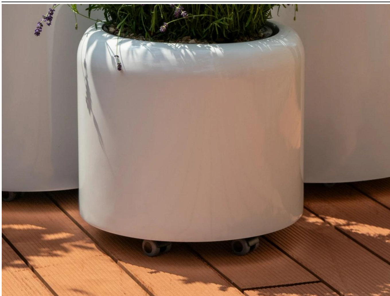
Podstawa z kółkami - opcja dodatkowa

BARTPOL Sp. z o.o. ul. Głogowska 218 60-104 Poznań NIP: 6932050703 t. 61 661 61 78 t. 607 531 181