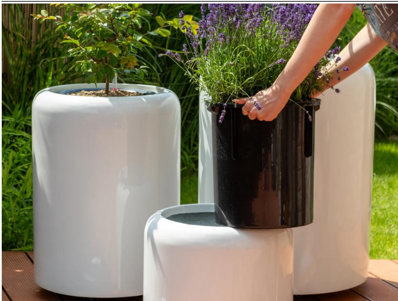
Wymowany wkład SWIP 31x33 cm w donicy AMBIENTE 35

BARTPOL Sp. z o.o. ul. Głogowska 218 60-104 Poznań NIP: 6932050703 t. 61 661 61 78 t. 607 531 181