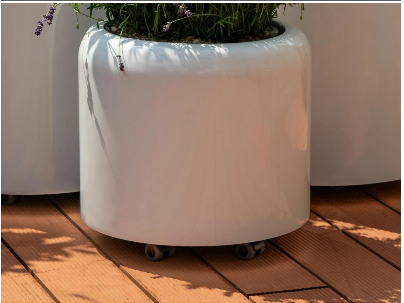
Podstawa z kółkami - opcja dodatkowa

BARTPOL Sp. z o.o. ul. Głogowska 218 60-104 Poznań NIP: 6932050703 t. 61 661 61 78 t. 607 531 181