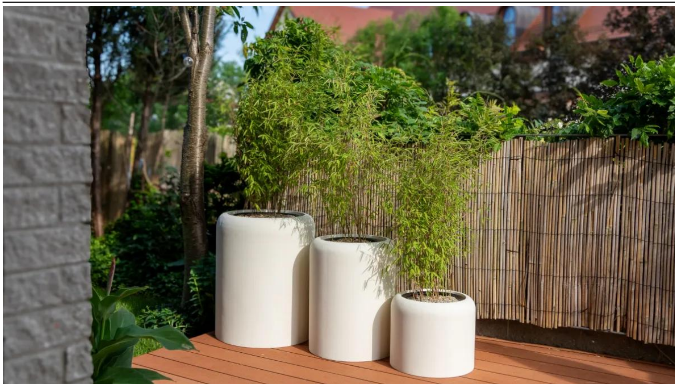
Powierzchnia donicy AMBIENTE 35 w kolorze biały beton przypomina beton architektoniczny

BARTPOL Sp. z o.o. ul. Głogowska 218 60-104 Poznań NIP: 6932050703 t. 61 661 61 78 t. 607 531 181