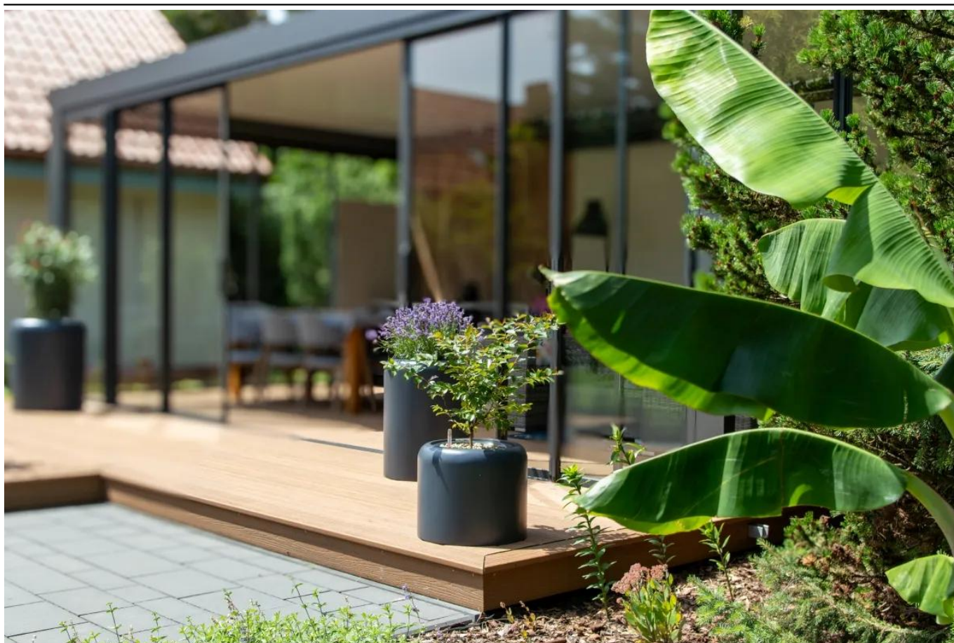
Lagerstremia indyjska w donicy AMBIENTE 35 antracyt mat

BARTPOL Sp. z o.o. ul. Głogowska 218 60-104 Poznań NIP: 6932050703 t. 61 661 61 78 t. 607 531 181