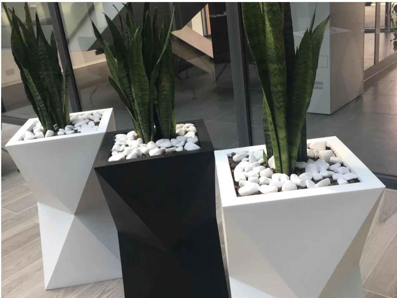
Donice Valencia w kolorze białym i czarnym

Ultranowoczesna donica Valencia to piękno geometrii w najczystszej postaci. Unikalny kształt będący połączeniem dwóch graniastosłupów intryguje i zachwyca od pierwszego spojrzenia.