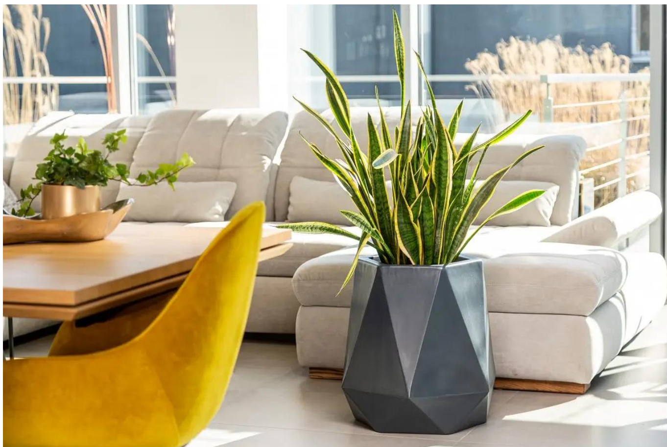
Antracytowa donica Flavi w salonie

Donica Flavi dostępna jest w dziesięciu kolorach, które można zobaczyć tutaj .