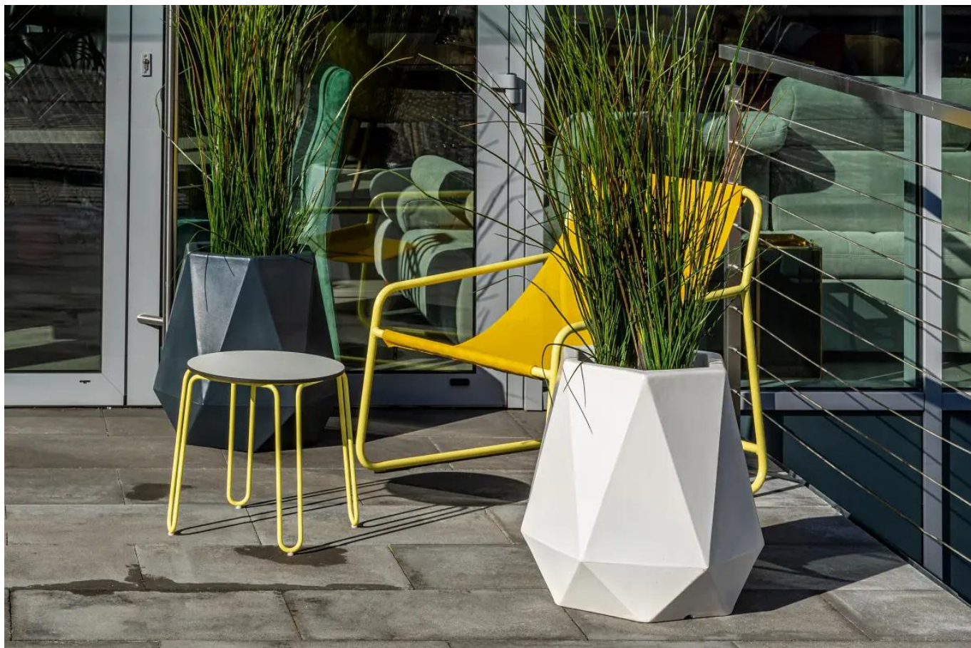
Donice Flavi w kolorze białym i antracytowym na tarasie

Donica Flavi dobrze prezentuje się w połączeniu z innymi designerskimi donicami firmy MONUMO, które można zobaczyć tutaj .