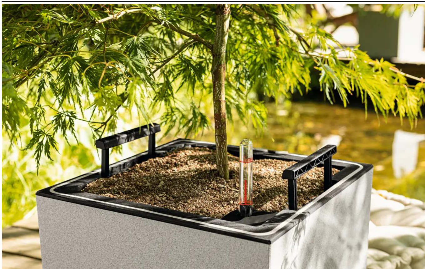
Biała podświetlana donica Lechuza CANTO Stone

BARTPOL Sp. z o.o. ul. Głogowska 218 60-104 Poznań NIP: 6932050703 t. 61 661 61 78 t. 607 531 181