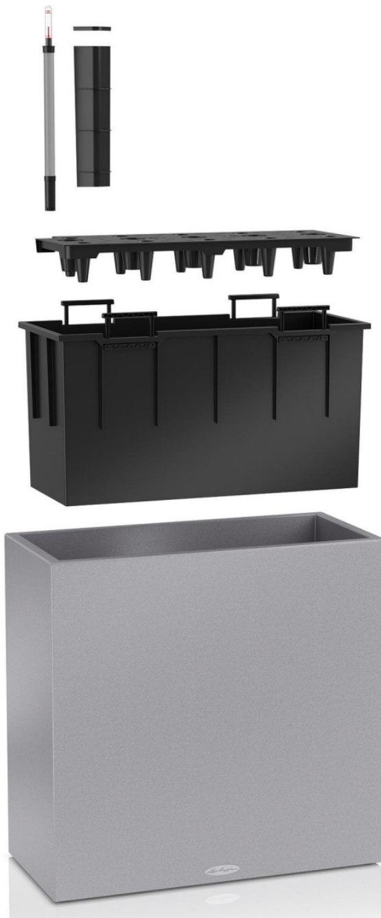
Donica tarasowa Lechuza Canto Stone 80 z wkładem i systemem nawadniania

Duża prostokątna donica Canto Stone 80 w kolorze biały kwarc, to doskonała donica na taras lub do dużego biura. Donica Canto Stone 80 posiada charakterystyczną dla całej serii STONE fakturę powierzchni przypominającą piaskowiec. Ta duża donica o regularnych kształtach i sporej pojemności pozwala na uprawę nawet bardzo dużych roślin zarówno na zewnątrz, jak i w pomieszczeniach. Zintegrowany z wyjmowanym wkładem system nawadniania z zasobnikiem o pojemności 12,5 litra istotnie ułatwia pielęgnację posadzonych w donicy Canto Stone 80 roślin i zapewnia im optymalny dostęp do wody wtedy gdy jej potrzebują. Wysokiej jakości tworzywo sztuczne (polipropylen PP) jest gwarancją trwałości i mrozoodporności donicy.