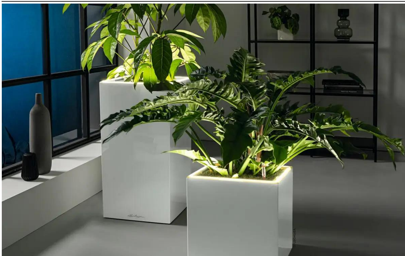
Białe donice CANTO Premium 40 LED w salonie

BARTPOL Sp. z o.o. ul. Głogowska 218 60-104 Poznań NIP: 6932050703 t. 61 661 61 78 t. 607 531 181