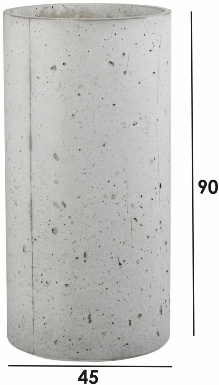
Wymiary donicy RING L

Donica RING dostępna jest w kilku wielkościach i kolorach. Wszystkie można zobaczyć tutaj .