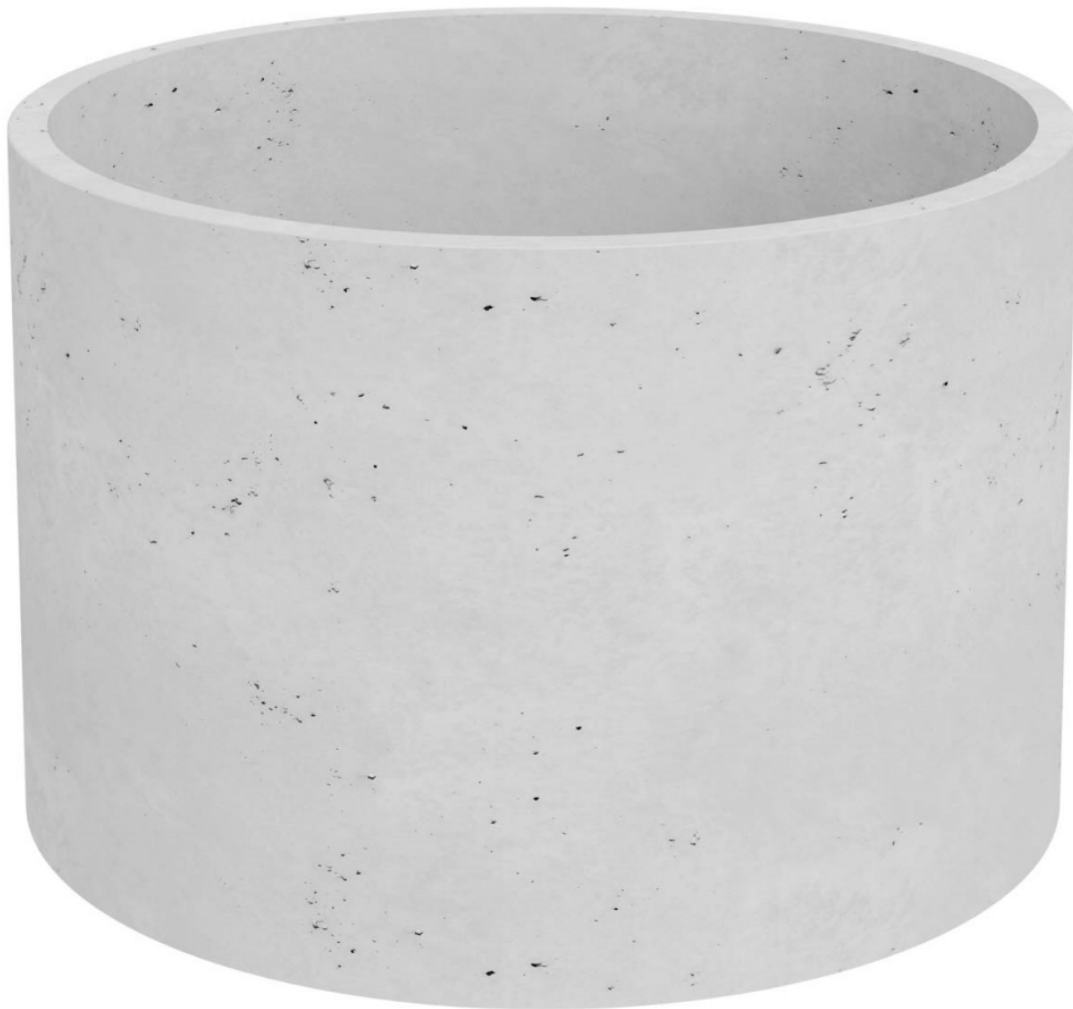
Donica z betonu architektonicznego RING EM w kolorze białym

BARTPOL Sp. z o.o. ul. Głogowska 218 60-104 Poznań NIP: 6932050703 t. 61 661 61 78 t. 607 531 181